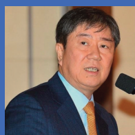
김대기 전 청와대 정책실장